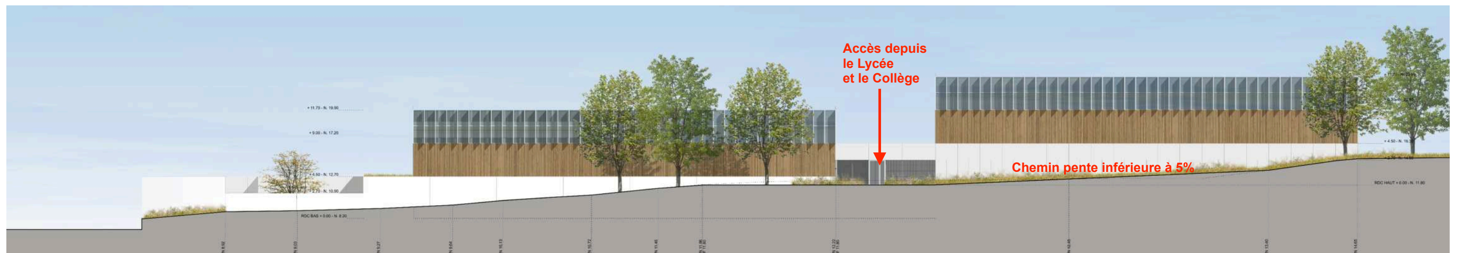
ÉLÉVATION OUEST 1/400