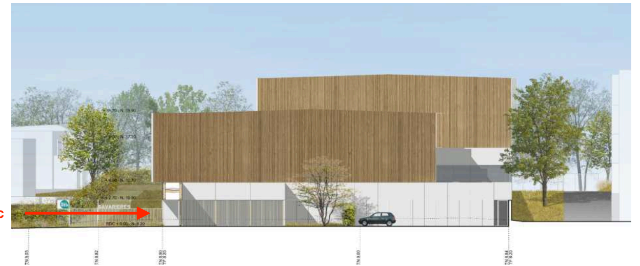
ÉLÉVATION NORD 1/400