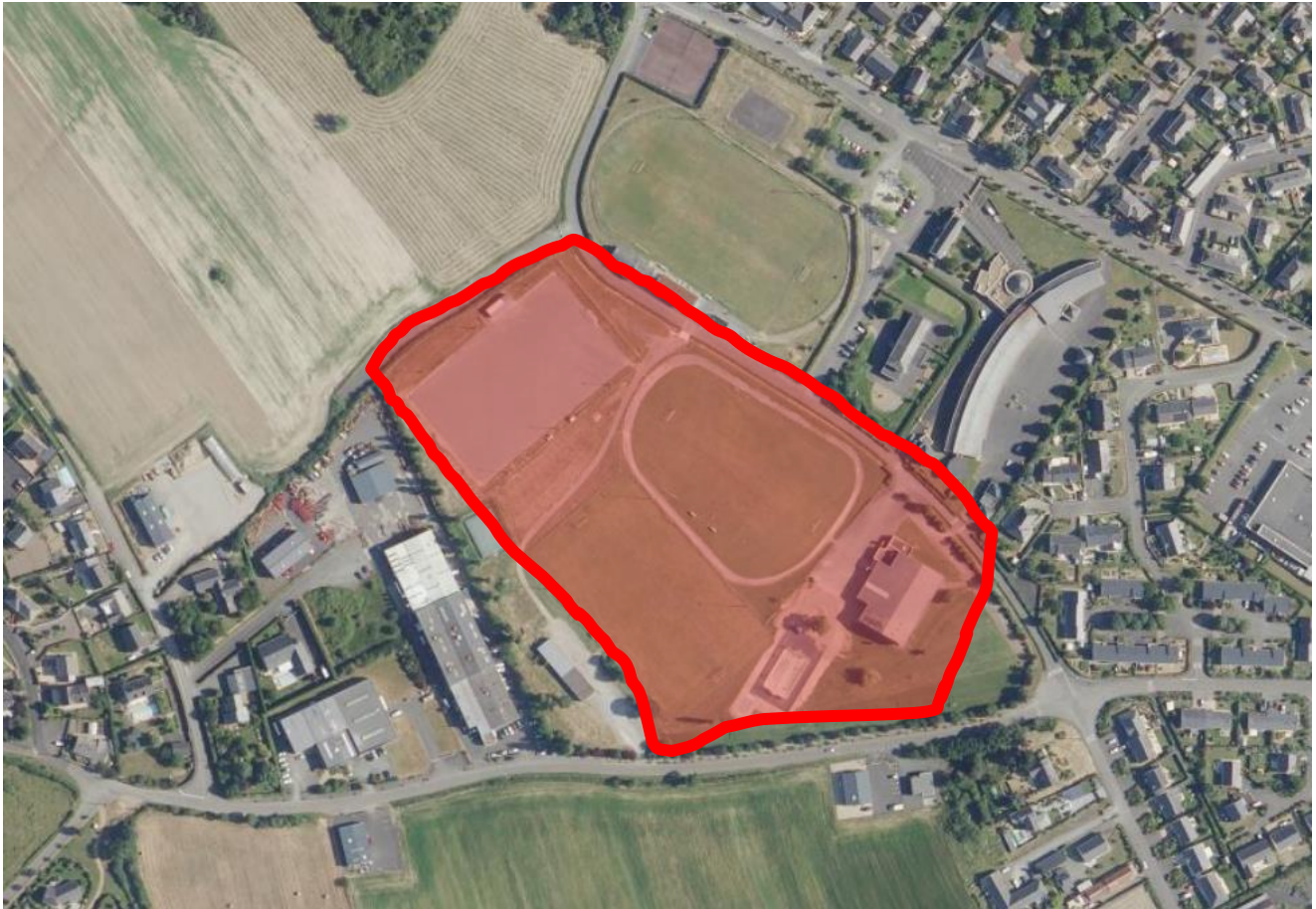
Figure 2 - Emprise du projet

Le site du futur complexe sportif occupe un espace d'environ 4ha.