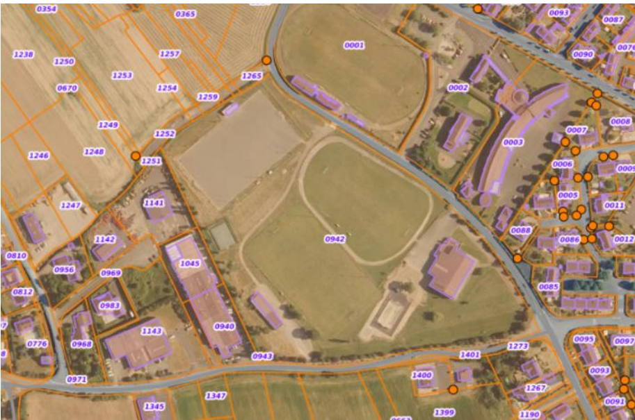
Figure 3 - Plan cadastral

Le projet sera implanté sur la parcelle OB 0942 :