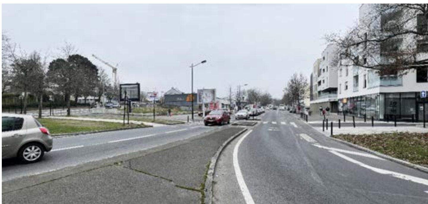
VUE 03 : Vue de l'îlot depuis le nord du boulevard du Tertre