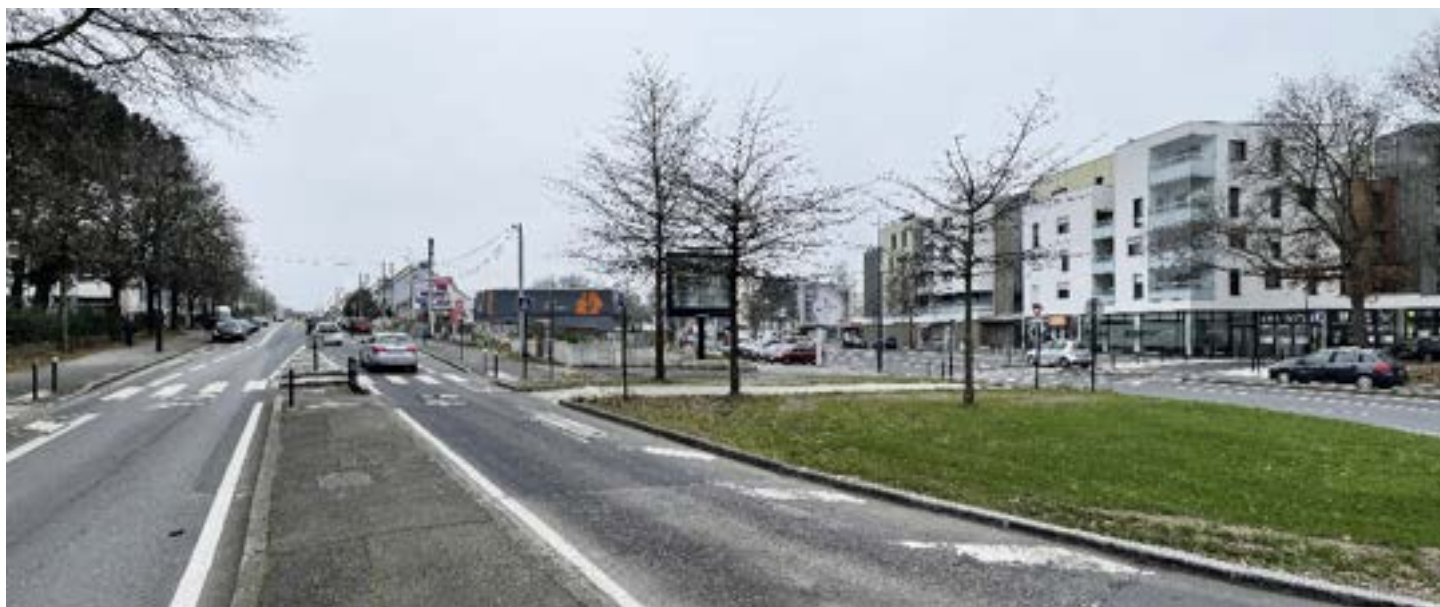
VUE 02 : Vue de l'îlot depuis le nord de la rue du Corps de Garde