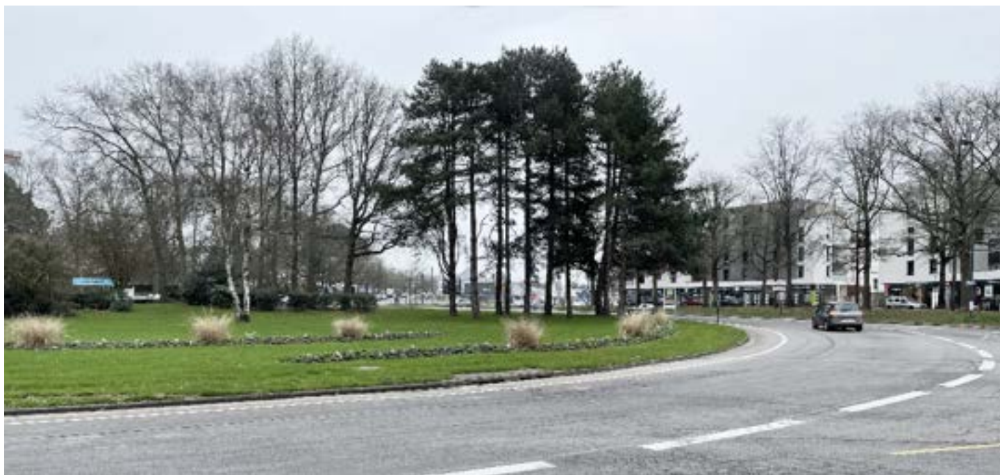
VUE 01 : vue lointaine depuis le nord du rond-point Abel Durand