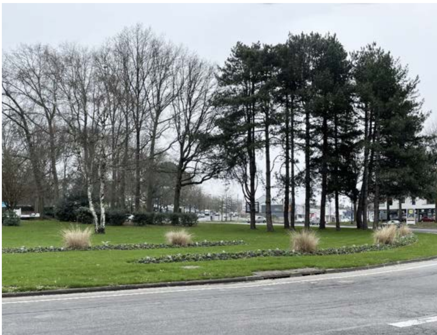
VUE 01 : Vue rapprochée à travers la masse boisée du rond-point Abel Durand

FAISABILITE • NANTES • Boulevard du Tertre