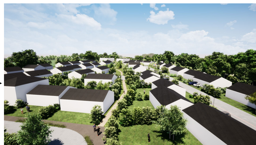
Vue rapprochée depuis le Sud

aménageur S.T.A. Aménageur foncier 192 Rue Nationale 49300 CHOLET Tél : 02 41 55 34 64 - Fax : 02 41 55 29 17 Email : www.sta-amenageur-foncier.com