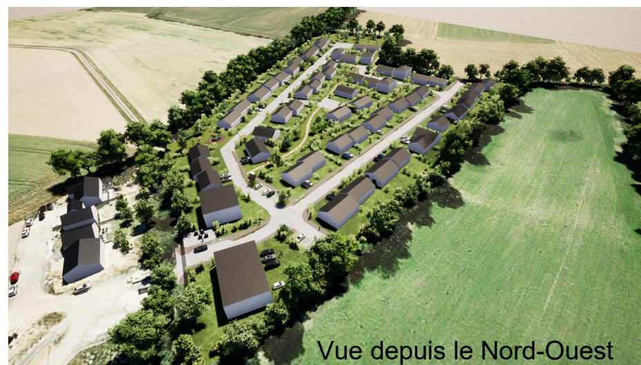
Vue depuis le Nord-Ouest