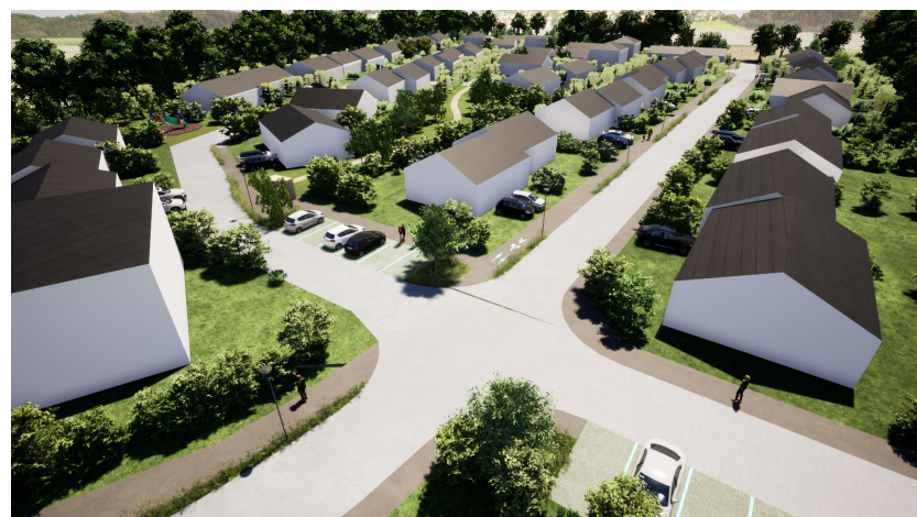
Vue rapprochée depuis le Nord-Ouest