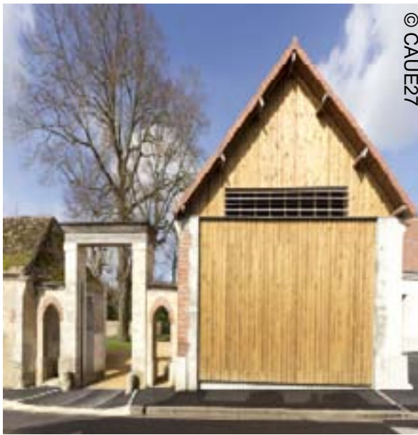
L'entrée des halles