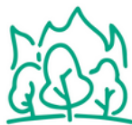
Incendies et végétation