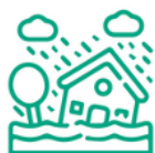
Milieux aquatiques et inondations