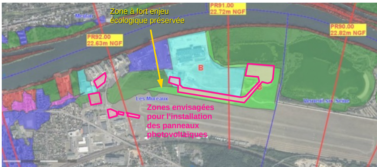
Illustration 1: Zonage du PPRI et projet ArianeGroup

Les emplacements envisagés pour l'installation des panneaux photovoltaïques sont concernés par trois zones du PPRI :