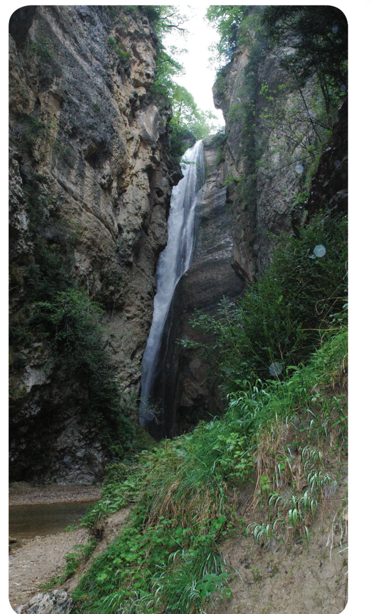
Gorges d'Omblez et cascade de la Drôme