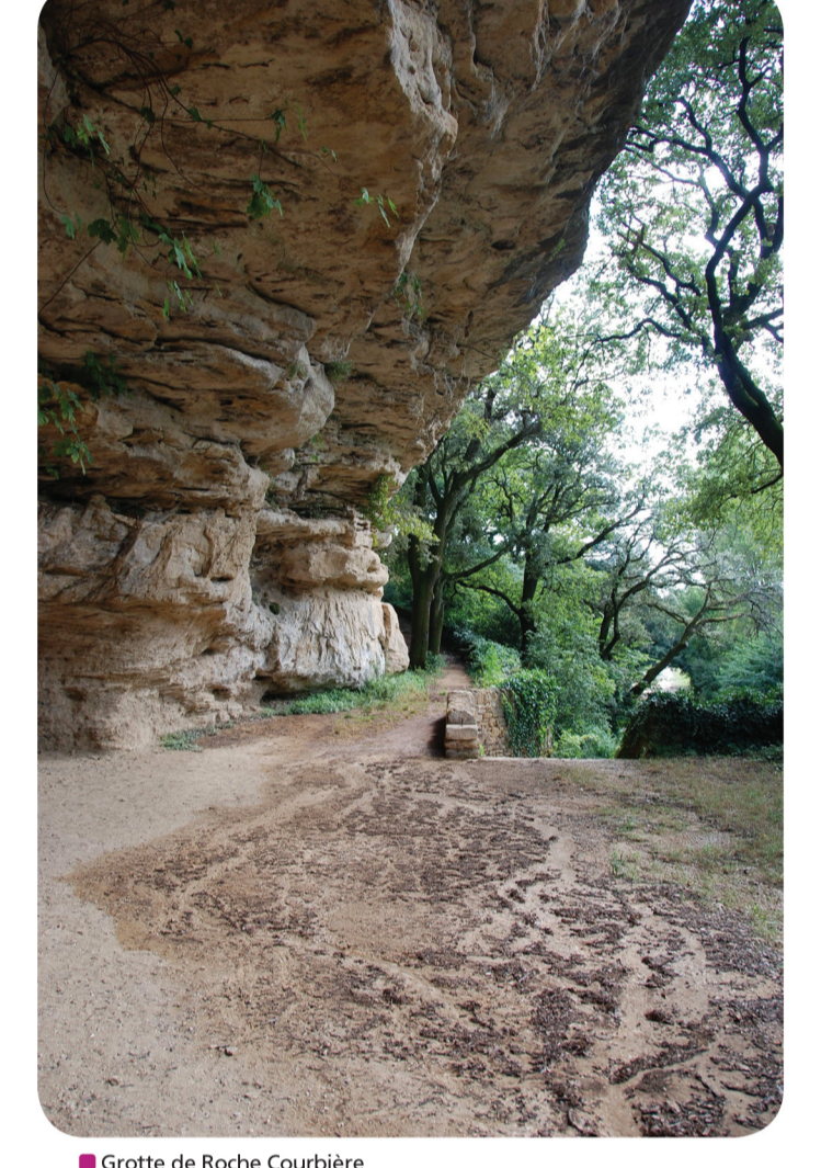
Grotte de Roche Courbière