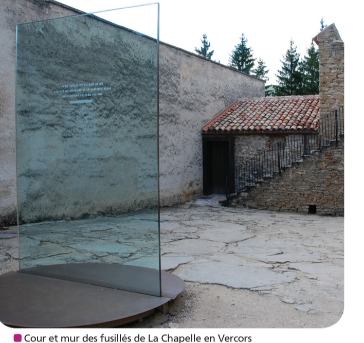
Cour et mur des Fusillés de La Chapelle en Vercois