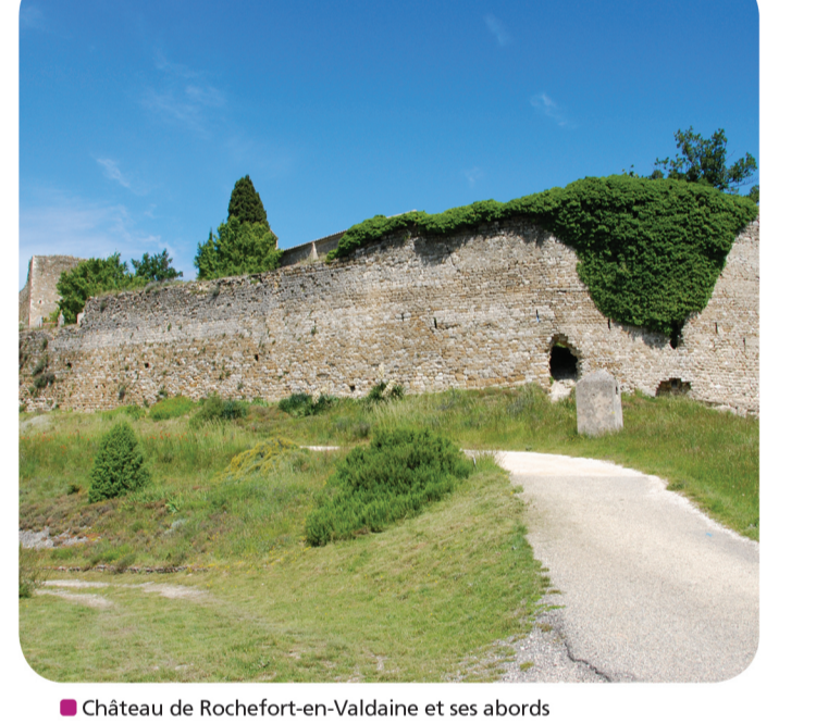
Châteaux de Rochfort-en-Valdaine et ses abords