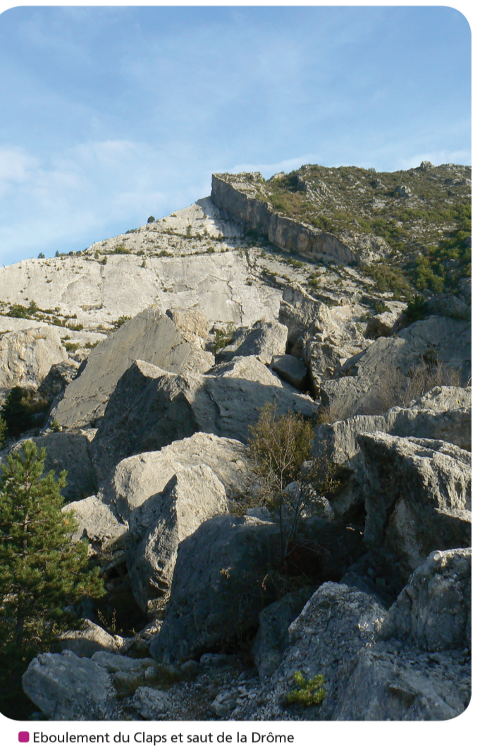
Boulonnement du Claps et saut de la Drôme