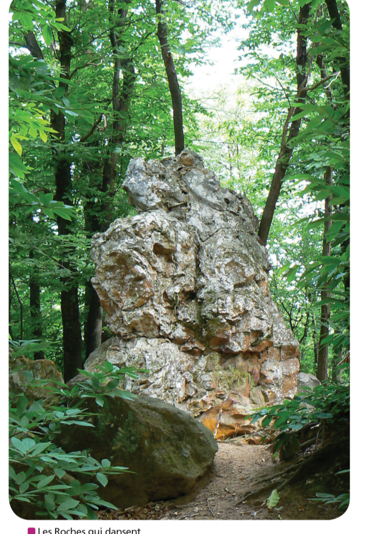
Les Roches qui dansent