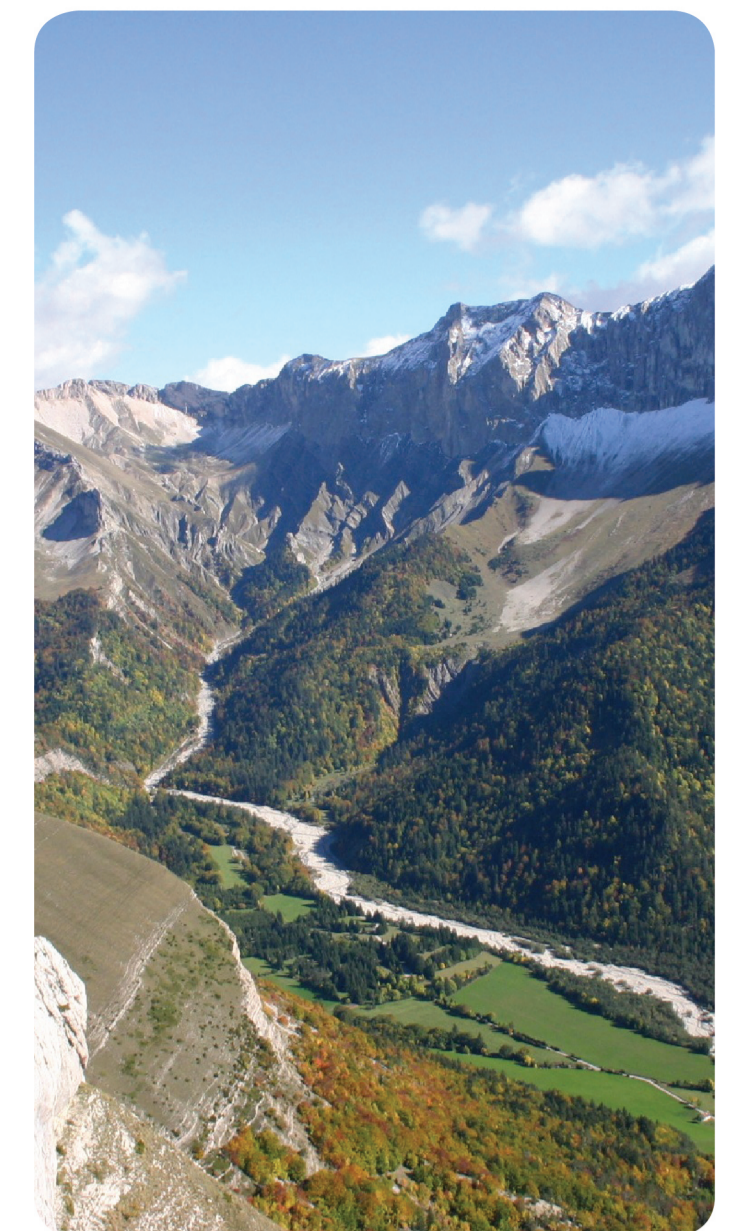
Vallon de la Jarjatte