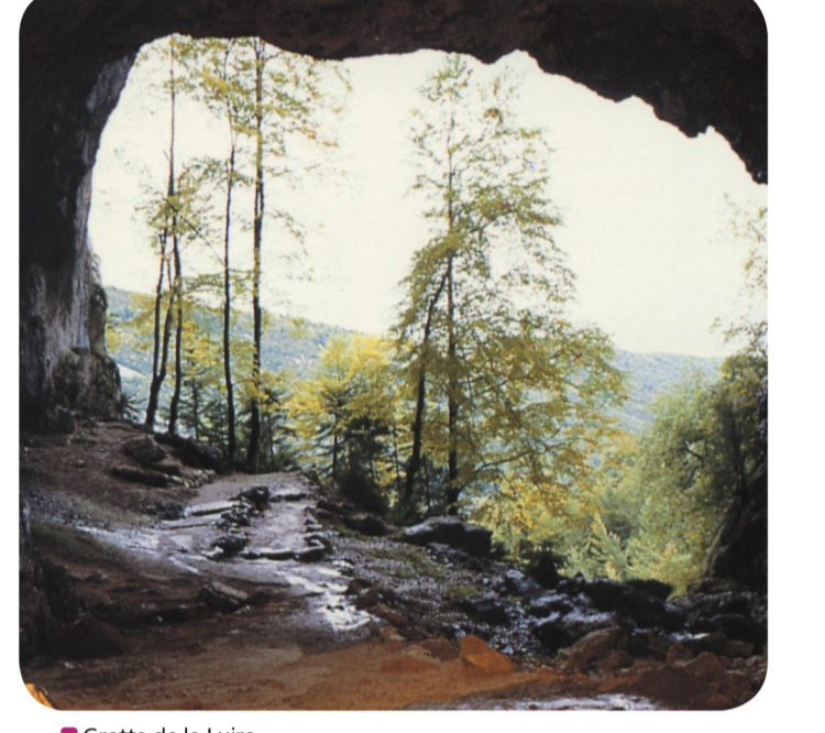
Grotte de la Luire