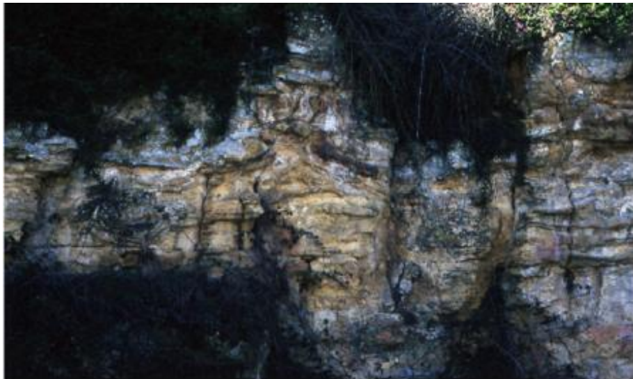
Figure d'échappement d'eau et surfaces d'omission /applications/www/igeotope-data/CEN0015/file_7