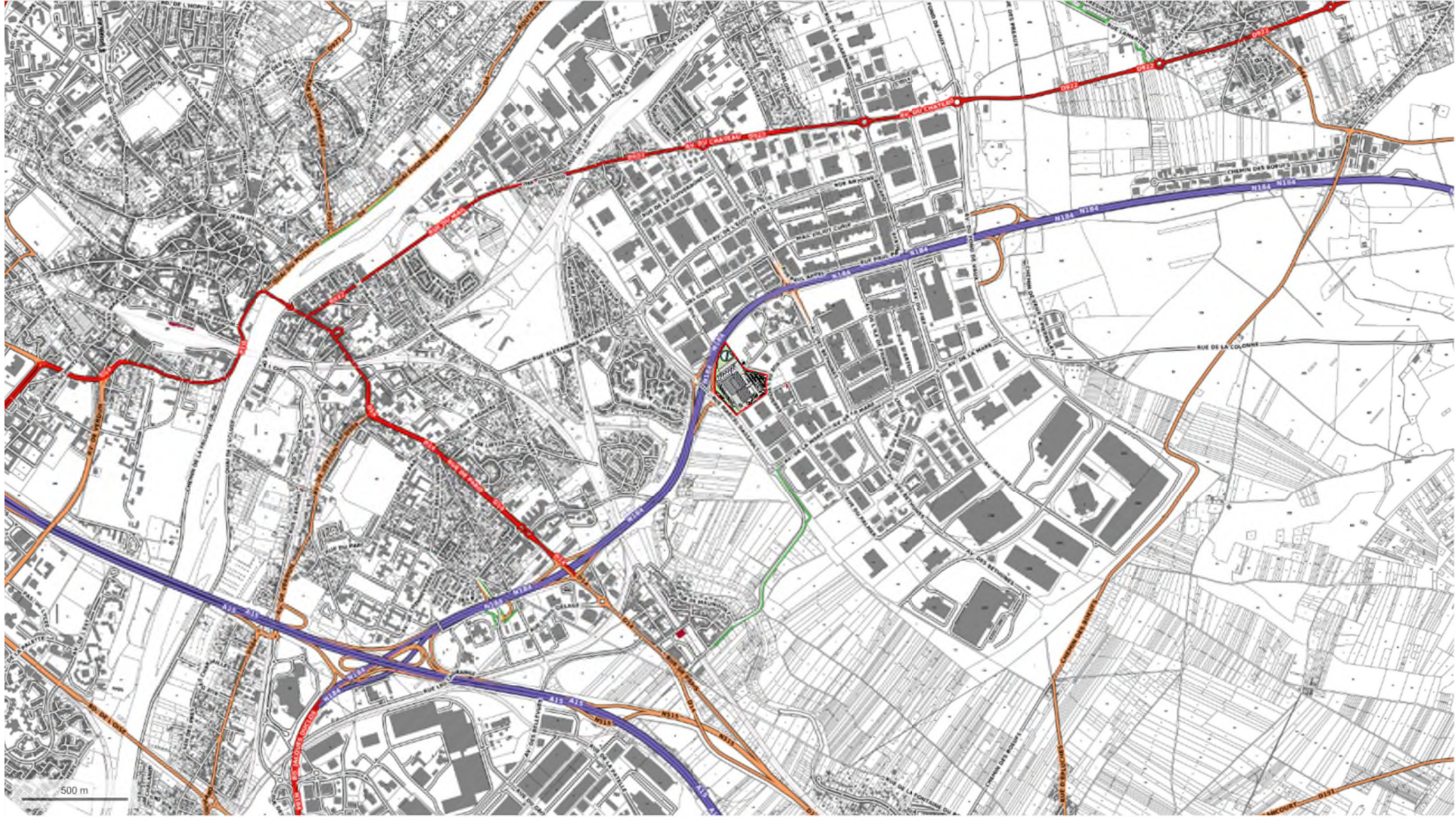
1 Plan de situation Ech : 1 : 25000