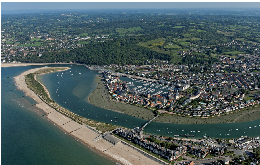
L'embouchure de la Dives/Marc Heller/DREAL BN

Le Profil environnemental a identifié huit composantes du patrimoine naturel bas-normand : le climat, l'air, l'eau, la biodiversité, la mer et le littoral, les sols, les sous-sols et le