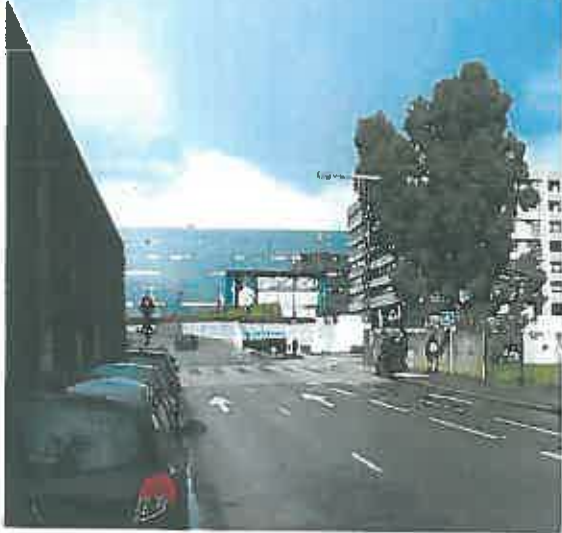
P1 mars 2014