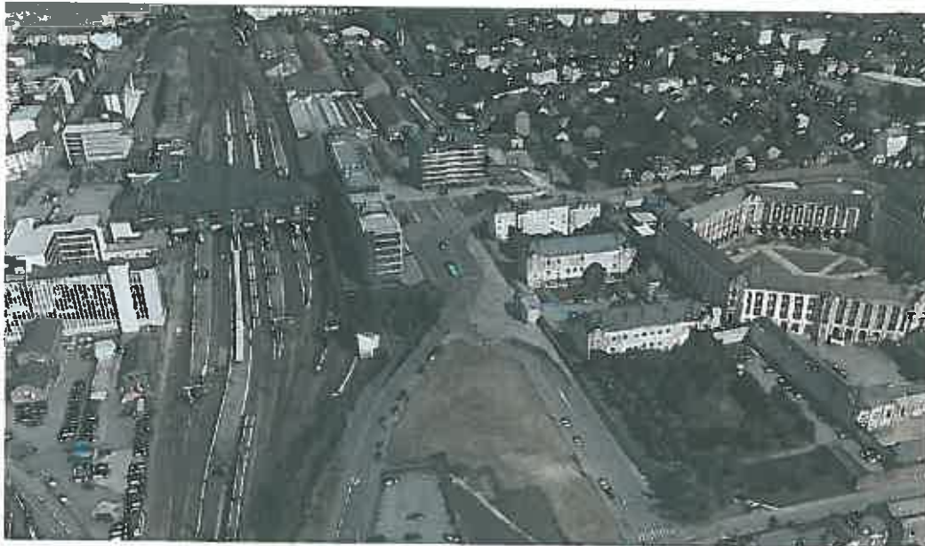
Vue aerielle oblique vers l'est. août 2013