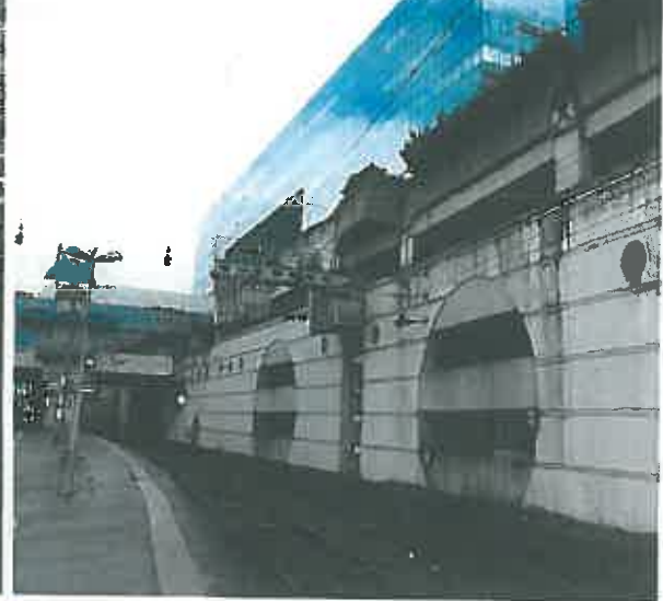
P3 mars 2014