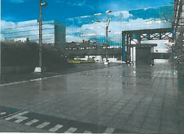
P2 mars 2014