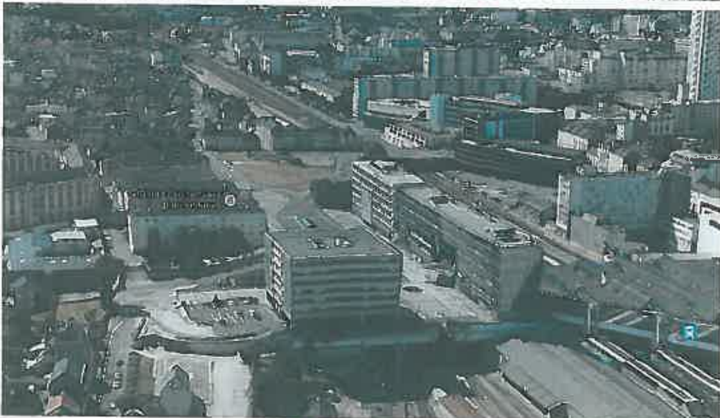
Vue aerielle oblique vers l'ouest. août 2013