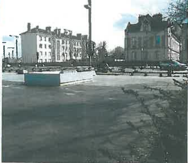
P5 mars 2014