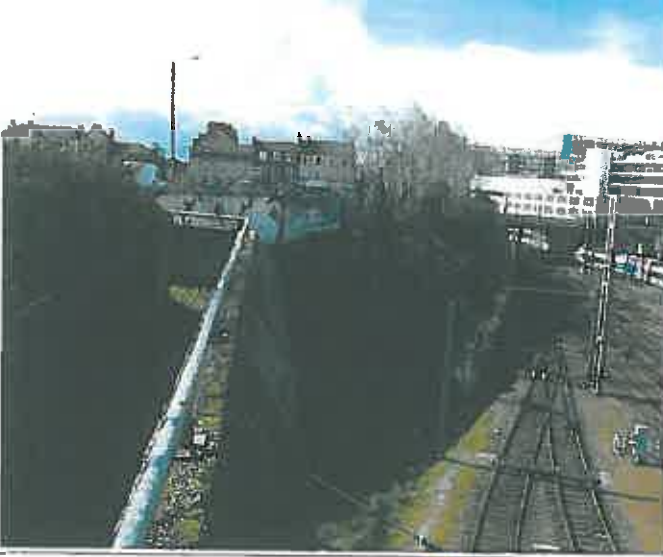
P4 mars 2014