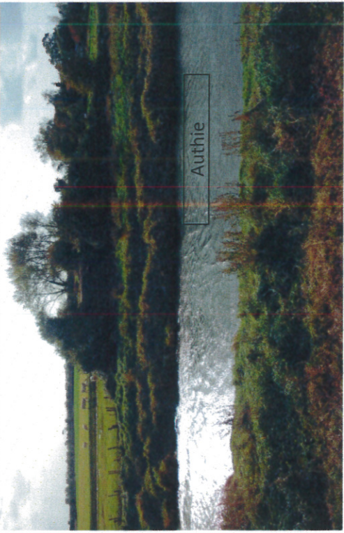
Le site du projet et son environnement proche : vue depuis la berge rive gauche de l'Authie

Date de la prise de vue : Septembre 2013