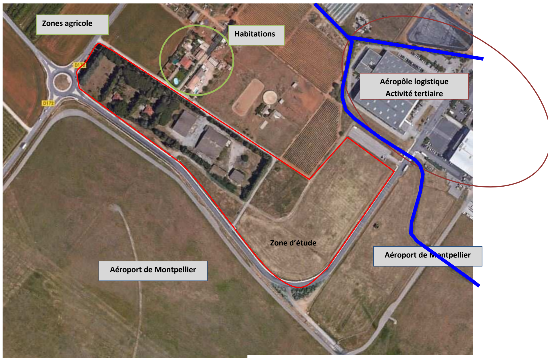
Photographie aérienne issue de google maps (26/01/2015)