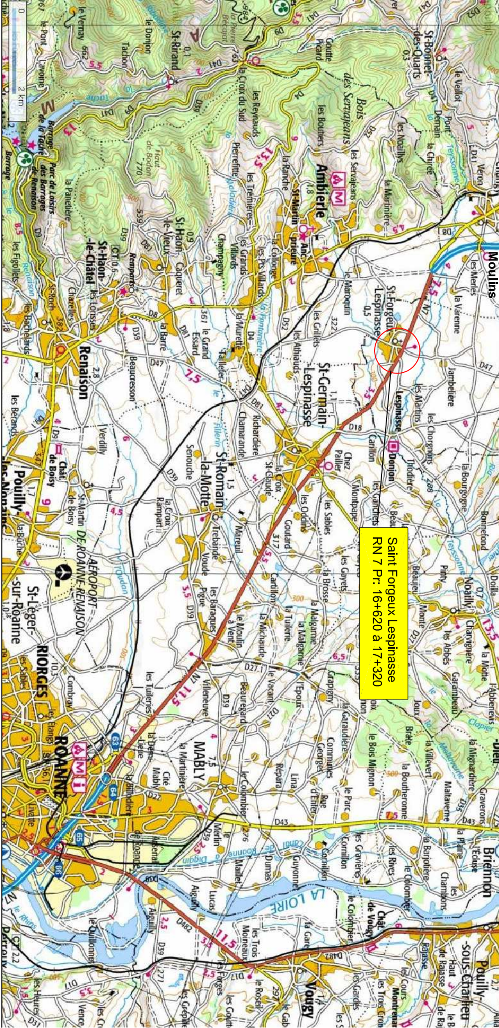
Plan de Situation - Saint-Forgeux Lespinasse -