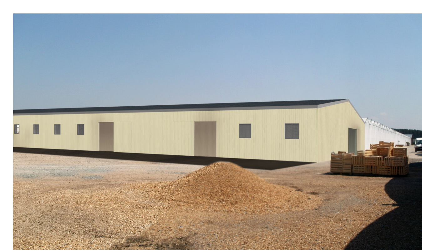
INSERTION DEPUIS LA VUE 3